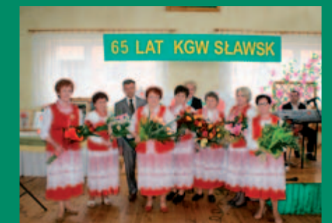
KGW Sławsk obchodziło w br. jubileusz 65-lecia działalności

„Nadziewiana kaczka” Specjalność Sołectwa Grabienice.